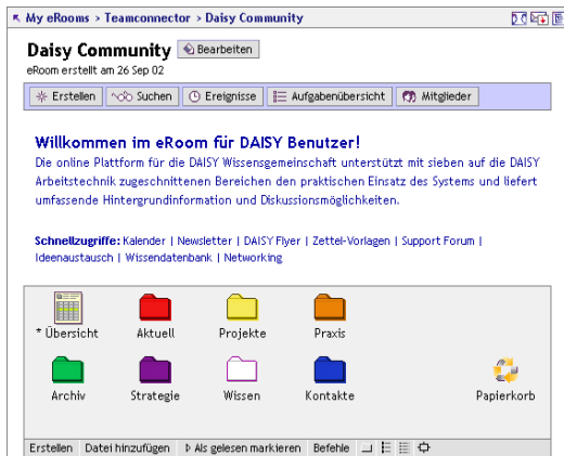
Abbildung: Einstiegsseite der Community Plattform

Die Wissensgemeinschaft zu den Themen Arbeitstechnik und Kreativität